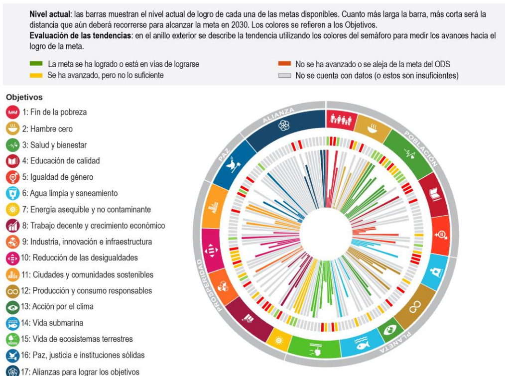
Gráfica 1. Costa Rica: Distancia por recorrer para lograr las metas de los ODS incluidas en este informe