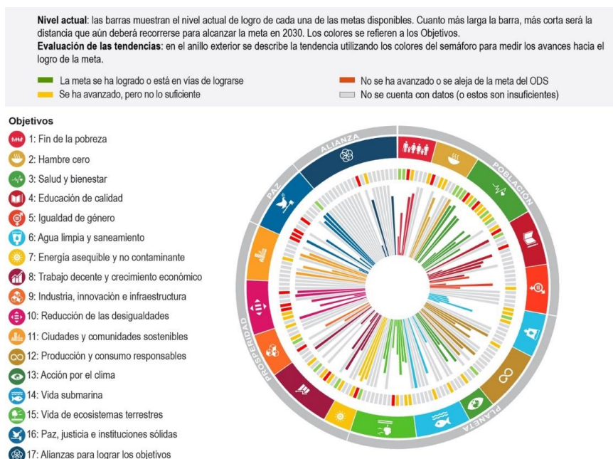
Gráfica 1. Colombia: Distancia por recorrer para lograr las metas de los ODS incluidas en este informe