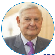
Francois-Xavier de Donnea PRÉSIDENT DU CLUB DU SAHEL ET DE L'AFRIQUE DE L'OUEST

Objet de graves inquiétudes, l'avenir des espaces saharo-sahéliens sera le thème du Forum du CSAO. Il est heureux de constater que la Communauté internationale se mobilise. L'adoption récente de la Stratégie intégrée des Nations Unies pour le Sahel en témoigne, de même que l'engagement de l'UE à travers sa stratégie pour le développement et la sécurité au Sahel ; de même encore que les initiatives fortes prises récemment par la Banque mondiale et la Banque africaine