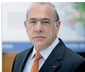
Angel Gurría Secrétaire général de l'OCDE