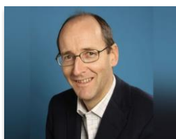
Rt. Hon. Andrew Tyrie

Président, Competition and Markets Authority, Royaume-Uni