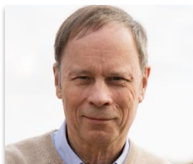
Jean Tirole Président Honoraire de la fondation JJ Laffont-Toulouse School of Economics, IAST